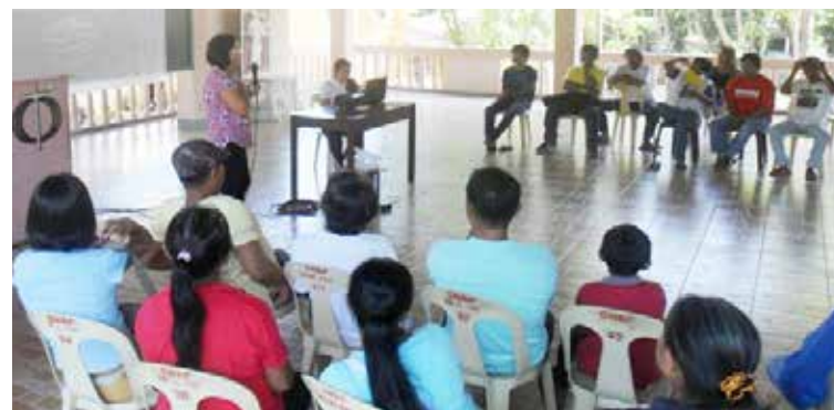
Ang mga parolado atol sa bansaybansay alang sa therapeutic treatment .

sa mga parolado nga may nagkalain-laing kaso. Gali community-based (o nakabasi sa komunidad)