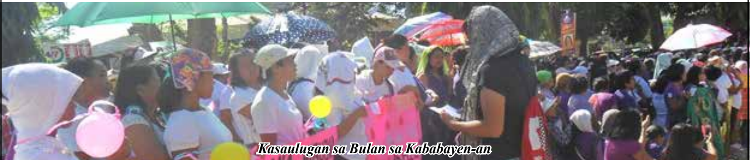
Kasaulugan sa Bulan sa Kababayan-an