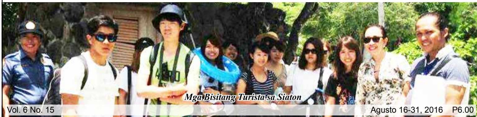
Mga Bisitang Turista sa Siaton