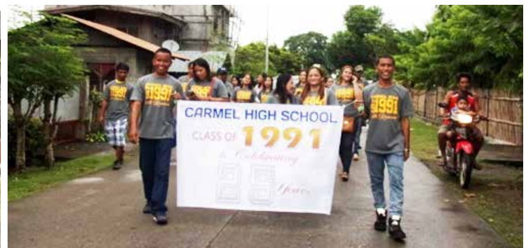
Ang Carmel High School nagsaulog sa ilang ika-54 nga Founders Day niadtong Disyembre 17.