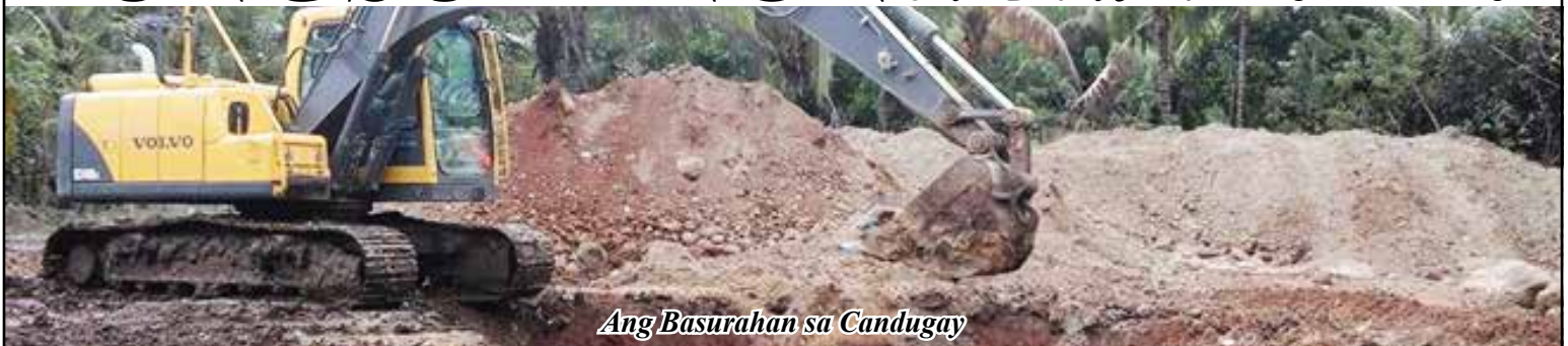
Ang Basurahan sa Candugay