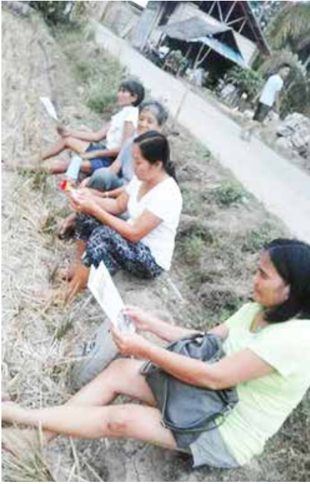
Nagbasa sa Kitang Lungsuranon ang mga lumulopyo sa Barangay Sumaliring, Siaton.